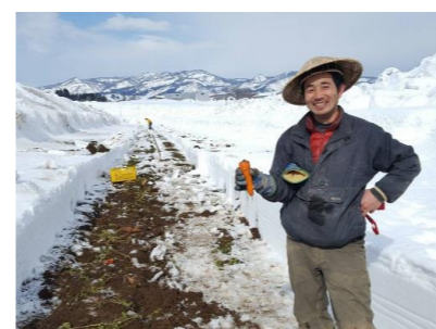
雪下にんじん農家さん