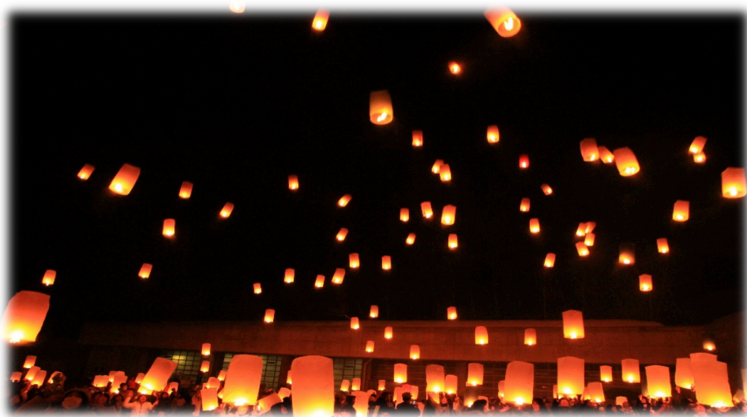
スカイランタン の宿