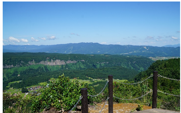
苗場山麓ジオパーク ニュー・グリーンピア津南展望台