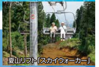
夏山リフト「スカイウォーカー」